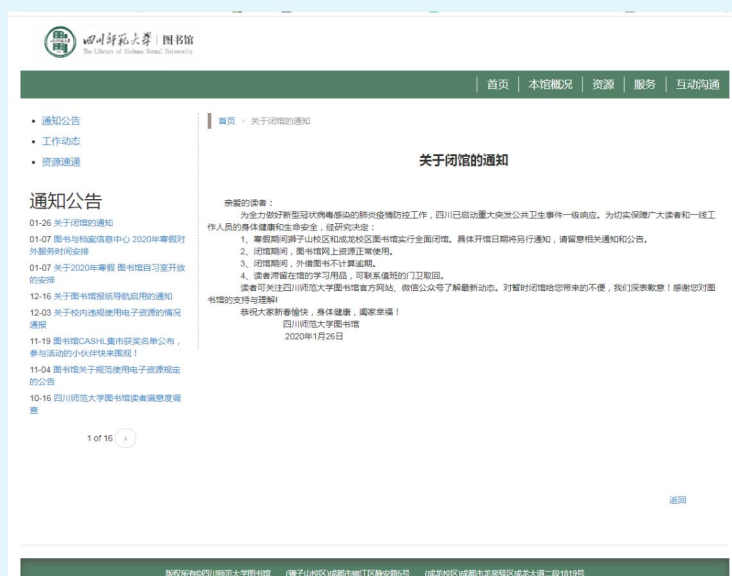
图 1 四川师范大学图书馆闭馆通知