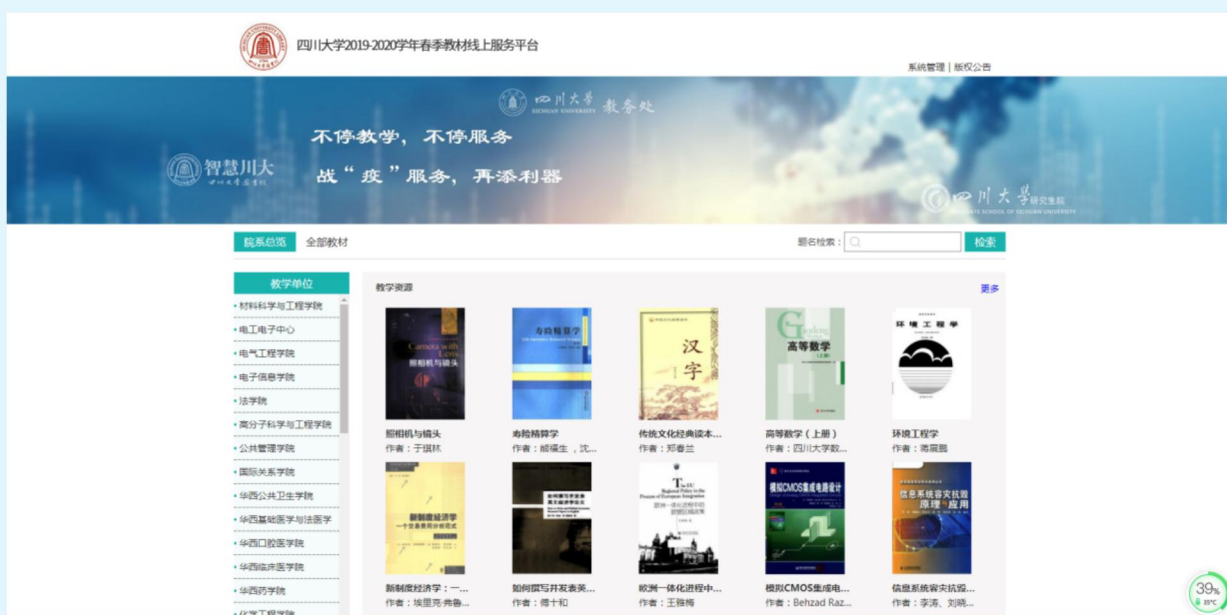
图8 四川大学图书馆电子教材线上服务

季学期教学工作的具体安排，为切实保障“停课不停学”的在线教学工作，全省高校图书馆立即行动起来，迅速采取多种管理服务措施，全力支持和保障全校在线教学活动顺利进行。