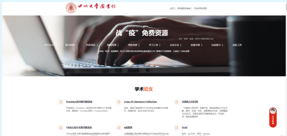
图6 四川大学图书馆战“疫”免费资源合集

馆不停服务—图书馆全天候网络学习资源免费开放”网上资源学习平台，阿坝师范学院图书馆发布“‘抗疫情’免费资源汇集”等，为师生提供了丰富的文献资源服务。