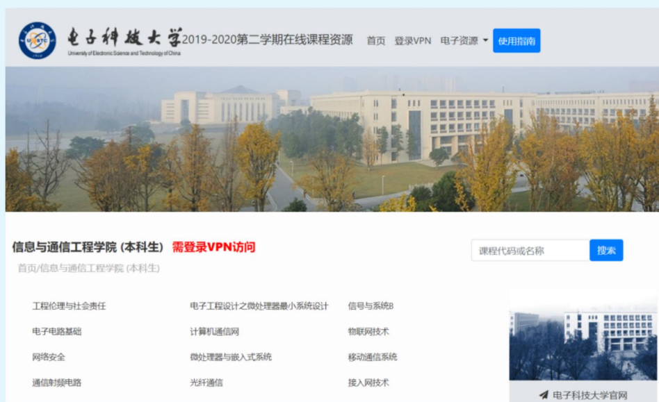
图 9 电子科技大学 2019-2020 第二学期在线课程资源平台

达到 25 万人次。教材电子图书的建设为学校 38 个教学单位（32 个学院、6 个其他教学机构）开展网络教学工作提供了坚实的文献资源支撑。同时，在加大已购买电子图书推荐服务和初步建设的教材教参选荐用平台的基础上，快速开通包含剑桥大学出版社精品教材、国际知名出版社德古意特（De Gruyter）经典教材、中华数字书苑、圣智（CEB Library）电子教参数据库、人民卫生出版社“人卫临床知识库”等 6 个电子书试用平台，直接服务人才培养第一线。