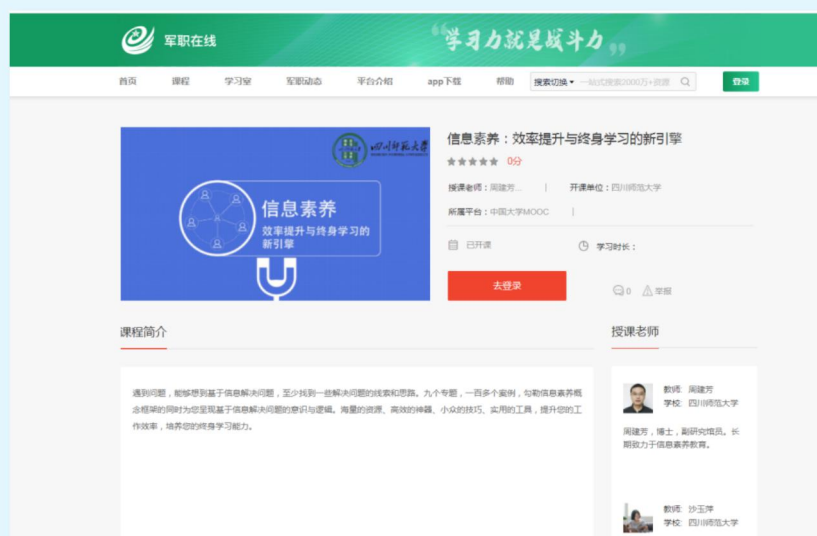
图 10 四川师范大学图书馆慕课《信息素养：效率提升与终身学习的新引擎》

四川大学图书馆在继续做好“一小时讲座”和院系定制化信息素养培训的同时，面向全校开设《信息检索与利用》课程，本学期共有 1290 名本科生选课，2 月 24 日正式开始利用 QQ 群课堂进行线上教学。老师们认真准备、认真授课，线上答疑、线上指导作业一丝不苟，同学们听课热情高涨，积极进行实践操作、认真完成作业。