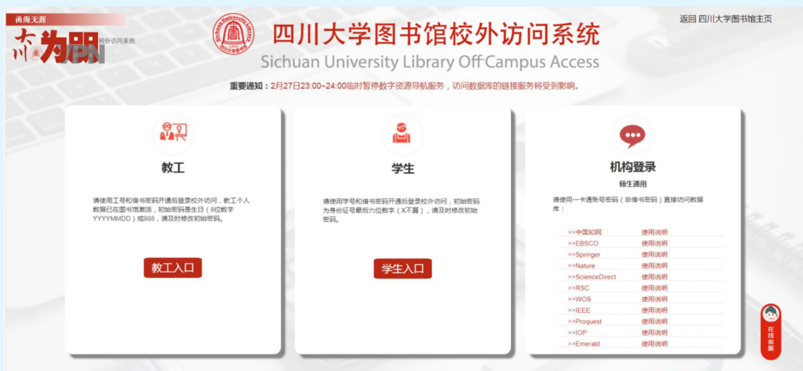
图 4 四川大学图书馆全新改版优化“大川为朋（VPN）”服务平台

四川大学、电子科技大学等高校图书馆在 CARS1 联盟的技术支持下完成机构登录的调试和开通，拓展中国知网、WOS、Elsevier、Springer 等国内外文献数据库的校外使用方式，为广大师生使用数字资源提供更加便利、顺畅的服务。