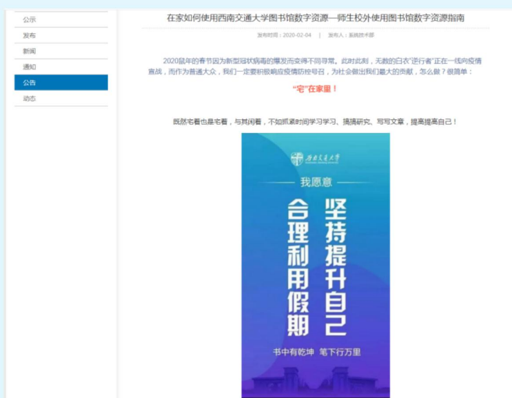
图5 西南交通大学图书馆师生校外使用图书馆数字资源指南

进行充分的准备和筹划，从硬件系统保障、应用服务保障、资源访问、远程监测、协调配合和网络咨询服务等方面进行周密的人员安排。1月28日至2月26日，四川大学图书馆主页访问超过22万人次，页面访问次数超过100万次；2月16日至25日，电子科技大学图书馆主页访问超过10万人次。