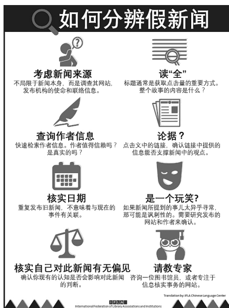
Fig.1 The Chinese version of the “how to distinguish false news” demonstration map issued by IFLA

查实内容、核实作者、证实真伪、核实时间、判断虚实、检查自身的偏见会不会影响判断、向专家求教 [3] 。这八个步骤还被国际图联做成了直观的演示图,征集翻译者,在网站上以41种语言、以PDF和JPEG两种格式发布,期待全世界的图书馆员和社会公众广泛下载、宣传 [4] 。在2018年的世界图书馆与信息大会期间,国际图联又发布了《国际图联关于假新闻的声明》。国际图联是图书馆行业的一个世界性组织,中国图书馆事业是世界图书馆事业的重要组成部分,对国际图联的号召我们理应积极响应。国际图联要求我们帮助公众提升数字素养、学会识别假新闻,这就是一个很好、很迫切的阅读推广切入点。